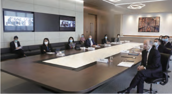
2020年12月，本會與中國證監會以視像會議形式舉行兩地監管機構高層會晤