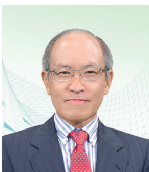
黃奕鑑 SBS, MH, JP