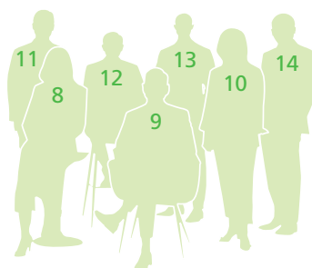
8. 梁鳳儀 9. 杜浚堃 10. 蔡鳳儀 11. 葉禮德 12. 黃奕鑑 13. 魏弘福(Christopher WILSON) 14. 周福安