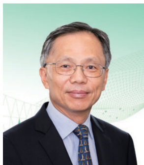
羅家駿 SBS, JP