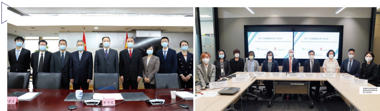
中國證監會稽查局(左)與本會法規執行部通過視頻方式舉行內地與香港第十三次高層執法合作會議

同年6月，證監會與馬來西亞證券事務監察委員會合辦了亞太區收購事宜監管機構會議。超過50名來自11個司法管轄區 5 的參與者聚首一堂，討論有關監管收購活動的近期發展及經驗，包括在疫情期間管理收購活動、股東行動主義和從收購違規事件汲取的教訓。