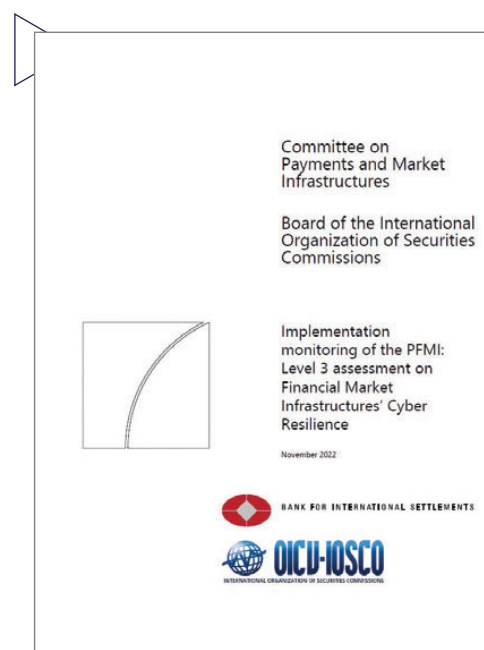
支付及市場基建委員會與國際證監會組織就金融市場基建設施的網絡防衛能力發出的評估報告(2022年11月)

在國際證監會組織內，我們積極參與理事會轄下所有工作小組、全部八個政策委員會、新興風險委員會(Committee on Emerging Risks)，以及評估委員會(Assessment Committee)的事務(包括檢視國際證監會組織《證券規管目標及原則》的實施情況)。在區域層面上，我們參與國際證監會組織亞太區委員會的工作，集中加強區內的監督合作，以及就跨境監管和市場碎片化作出應對。年內，證監會成為《亞太區委員會多邊監督合作諒解備忘錄》的簽署機構。