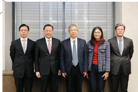
(左至右)本會市場監察部執行董事梁仲賢先生、本會主席雷添良先生、中國人民銀行行長易綱先生、本會行政總裁梁鳳儀女士和中國人民銀行副行長宣昌能先生