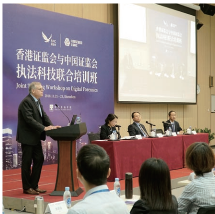
證監會與中國證監會於深圳舉辦聯合培訓

12月，證監會與中國證監會於香港舉行第七次有關執法合作的定期高層會議，討論一系列事宜，包括市場監察的工作流程及程序，以及需優先處理的調查的進展。有關會議對於打擊跨境市場失當行為，以及維持兩地市場互聯互通計劃的有序運作十分重要。