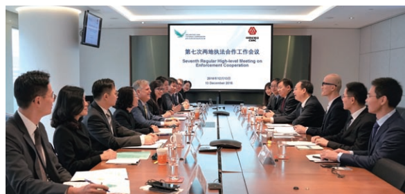
證監會與中國證監會舉行第七次有關執法合作的定期高層會議