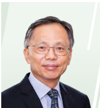
羅家駿 SBS, JP