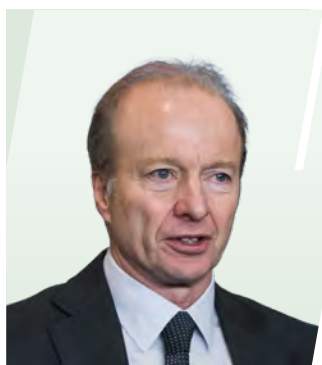
歐達禮 (Ashley ALDER) SBS · JP