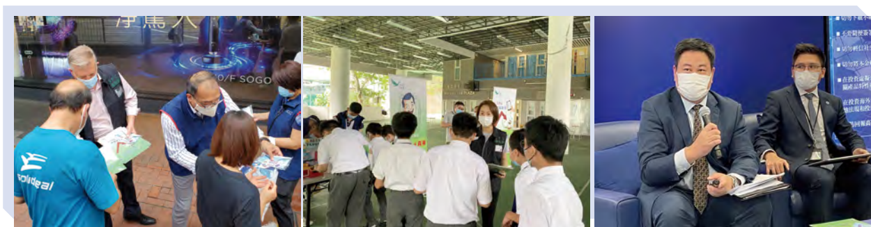
社區外展活動及訪問

本會在2021年6月向持牌中介人發出通函，提醒他們在《操守準則》 4 下有責任就疑似“唱高散貨”騙局通知本會。