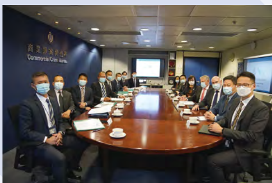
與警務處商業罪案調查科人員會晤