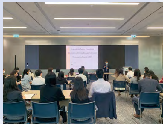
調查員的培訓工作坊