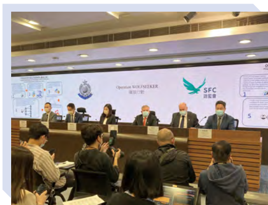
與警方針對跨境“唱高散貨”騙局聯合行動的新聞發布會