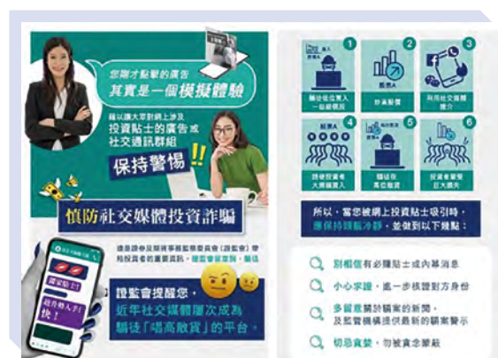
提醒公眾慎防“唱高散貨”騙局的網上宣傳活動

本會於2021年5月舉行網上宣傳活動，讓網民體驗模擬被捲入社交平台上的“唱高散貨”騙局 3 。在有關活動期間，我們登載了多個網頁橫額，當中標示用來誘使潛在受害者加入騙局相關網上聊天群組的常見用語，並將點擊網頁橫額的瀏覽者轉接至本會為提醒他們慎防有關騙局而設的網頁。本會促請投資者在作出投資前，必須仔