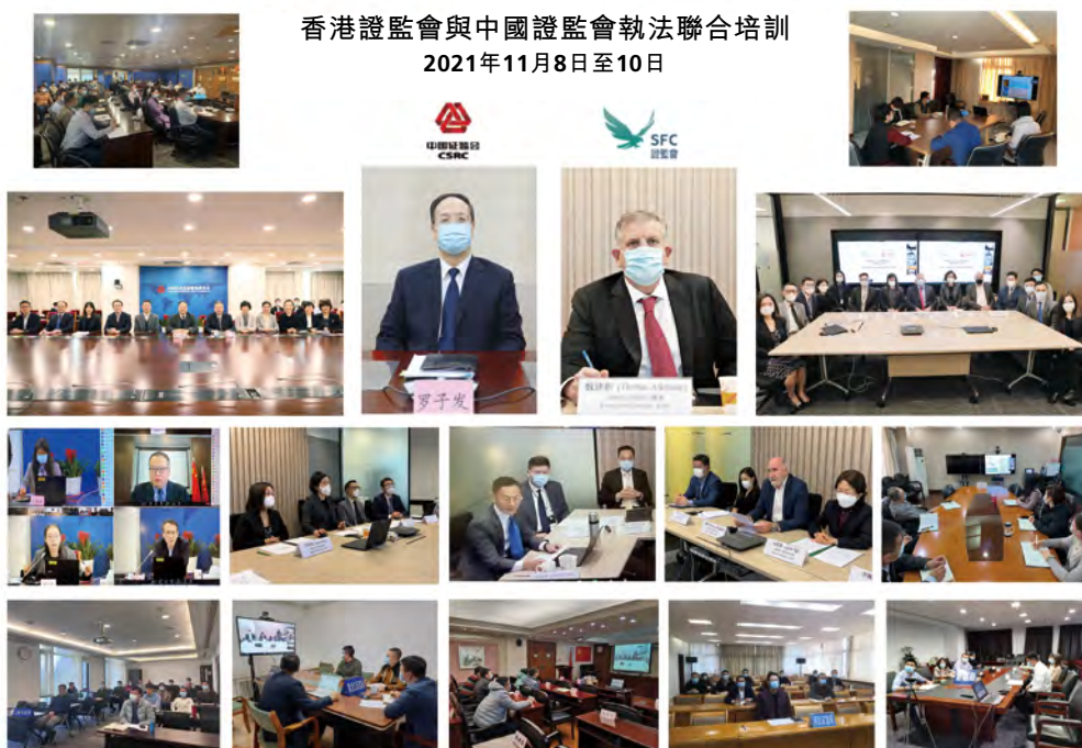
香港證監會與中國證監會執法聯合培訓 2021年11月8日至10日

多年來，兩會已經建立了常態化、多層次和全方位的跨境執法合作和交流機制，這是促進兩會執法合作高效率和高品質運行的重要保障。兩會均期待在未來能繼續拓展和深化這一緊密合作關係。